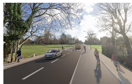
Vue projetée – résultat final