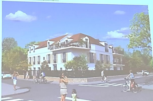
1. Présentation du projet