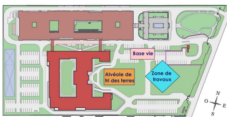
L'implantation du chantier